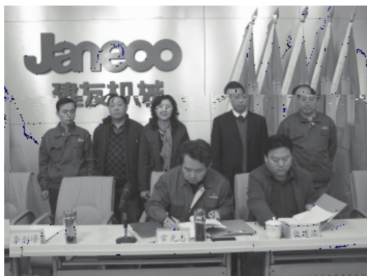
建友签约: 山东大学与山东建设机械股份有限公司联合举办研究生课程进修班签约仪式在山东建设机械股份有限公司会议室举行。