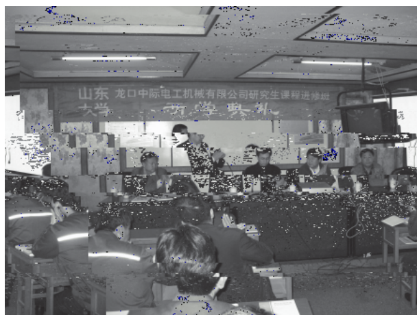
中际开班 山东大学机械工程学院与山东中际电工机械有限公司联合举办的研究生课程进修班开学典礼在龙口中际电工机械有限公司举行。