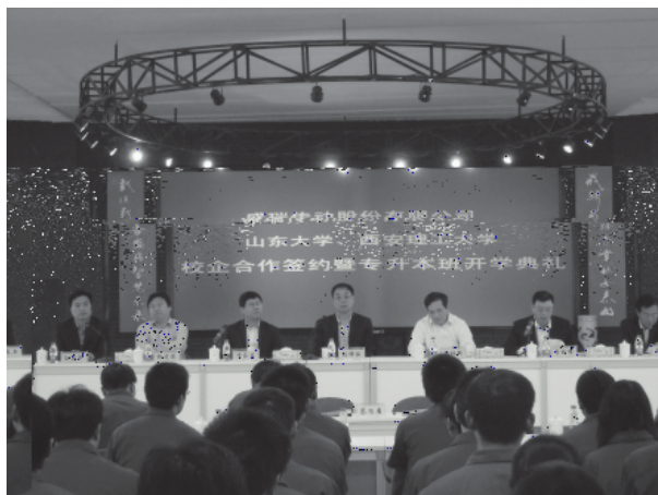
盛瑞开班 山东大学与盛瑞传动股份有限公司联合举办的成人高等教育函授班开学典礼在潍坊市盛瑞传动股份有限公司举行。

按照国家教育部的要求，为解决函授生的工学矛盾，方便学生学习，山东大学在山东省的大部分地市设立了函授教学站。录取后，大部分函授生可在当地函授站参加学习。各函授站的招生专业及学习方式，请咨询您所在地市的山东大学函授站（各地市函授站地址及咨询电话见山东大学成人高等教育当年招生简章）。