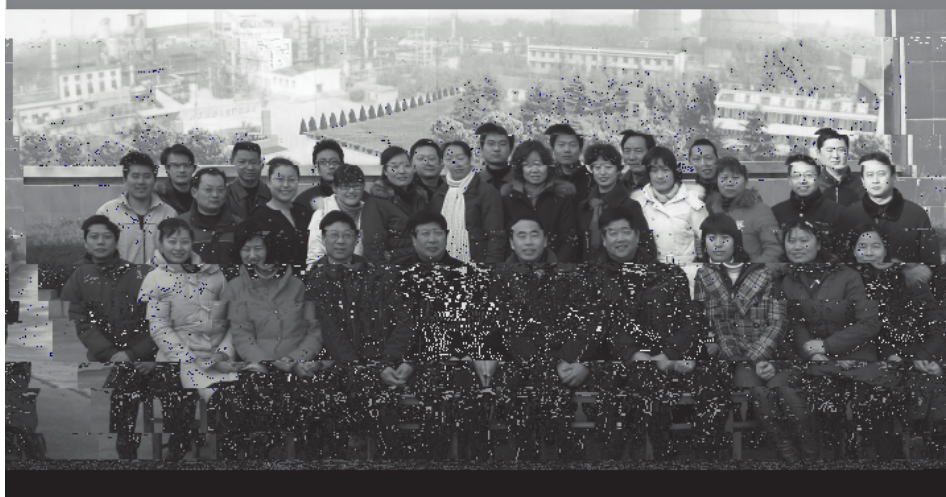
焦化厂班毕业合影：山东大学与兖州矿业集团焦化厂联合举办的山东大学成人高等教育函授班毕业学员在邹城市兖州矿业集团焦化厂合影留念。